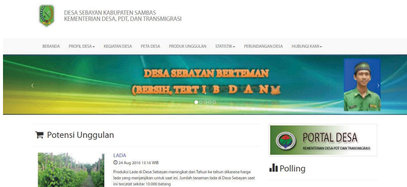
Gambar 7.3 Tampilan Beranda Website Desa Sebayan

Website yang dimiliki oleh Desa Sebayan memiliki format yang sama dengan semua website yang difasilitasi oleh Kementerian Desa. Website berisi profil desa, kegiatan desa, peta desa, produk unggulan, statistik, serta perundangan desa. Desa Sebayan termasuk cukup aktif memperbarui isi websitenya meski masih sangat sederhana. Kegiatan desa adalah laman yang paling sering diperbarui. Laman ini tidak hanya berisi kegiatan perangkat desa, tetapi juga kegiatan BPD.