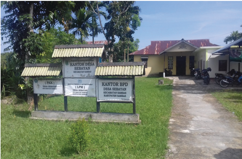
Gambar 7.1 Kantor Desa Sebayan

dan perkebunan di samping kantor desa yang menyediakan pupuk, benih, obat pembasmi hama, dan sebagainya. Toko pertanian ini melayani tidak hanya penduduk Desa Sebayan, melainkan juga pembeli dari desa-desa lainnya. Selain itu, desa ini juga tengah membangun rumah kos 10 kamar di belakang kantor desa untuk melayani para mahasiswa yang kuliah di Desa Sebayan.