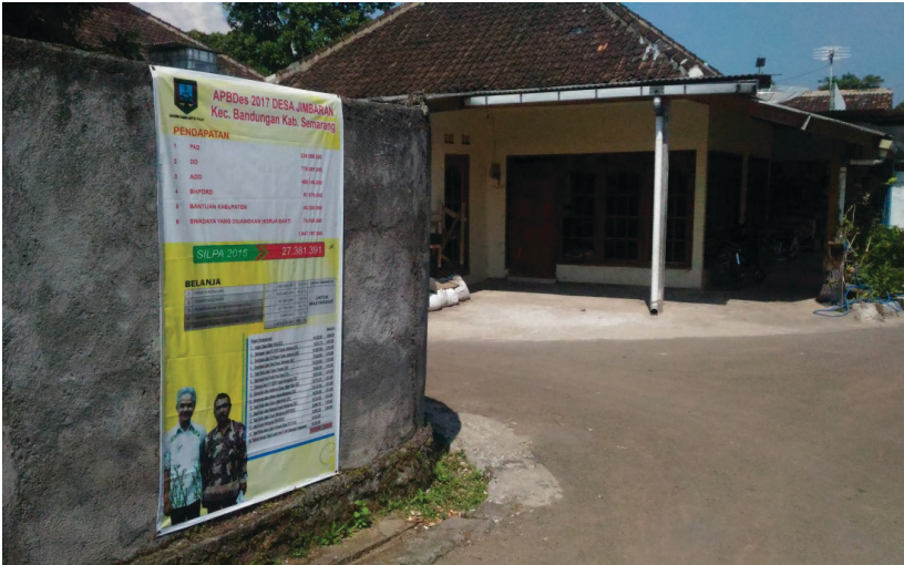
Gambar 4.1 APBDes yang Dipasang di Tempat-Tempat Strategis

Jika format yang mengacu pada karakter masyarakat offline lebih merupakan kombinasi inisiasi warga maupun pemerintah, maka format SID berbasis website ini lebih banyak diinisiasi oleh pemerintah, terutama dari instansi vertikal, yaitu langsung dari kementerian pusat, seperti Kementerian Desa. Sejauh ini, masih belum ada yang dibentuk oleh LSM atau warga sendiri. Meskipun demikian, secara keseluruhan, format SID di Desa Jimbaran lebih merupakan kombinasi antara sistem informasi desa yang dibentuk berdasarkan karakter masyarakat offline , dan sistem informasi berbasis website.