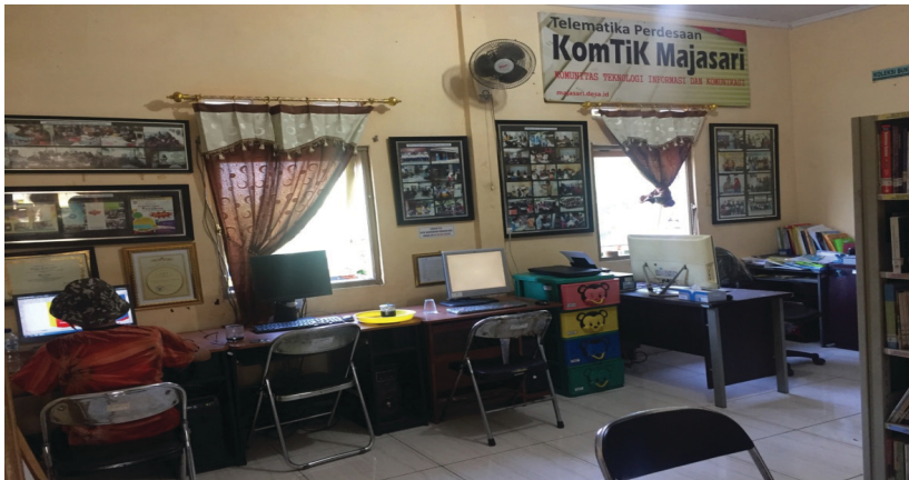
Gambar 6.1 Ruang perpustakaan Desa Majasari juga memiliki lima komputer meja