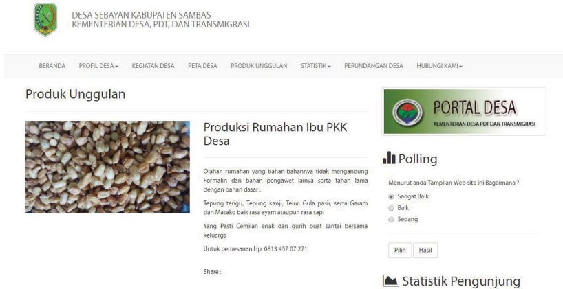
Gambar 7.4 Contoh isi website Desa Sebayan. Potensi desa belum dipromosikan secara maksimal.

jelas produk apa yang dimaksud. Meski dari informasinya dapat ditebak bahwa produk tersebut berupa makanan, tidak ada nama spesifik dari produk unggulan tersebut.