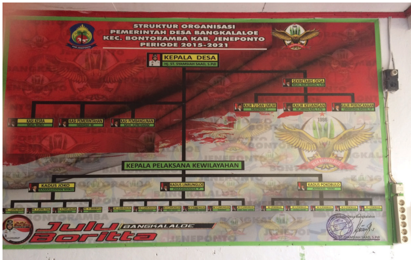
Gambar 5.1 Papan informasi aparat Desa Bangkalaloe

Informasi untuk warga biasanya dimunculkan melalui papan informasi dan baliho. Papan informasi terpasang di balai desa yang menyampaikan informasi standar tentang desa dan informasi terkini. Baliho, di sisi lain, di pasang di ruang publik, dan digunakan untuk menyampaikan informasi tentang penggunaan dana desa.