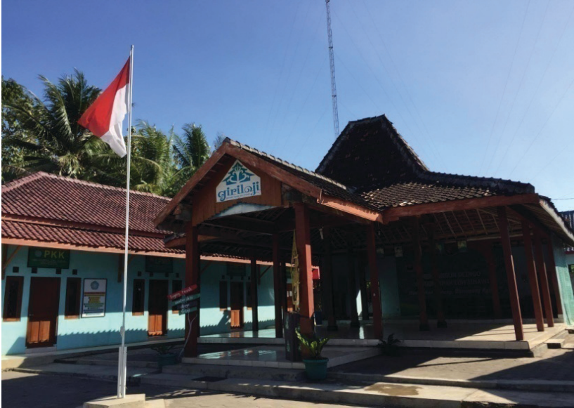
Gambar 3.1 Balai Desa Dlingo

yang paling banyak dikembangkan. 3 Untuk membina potensi budaya ini, Desa Dlingo mempunyai Lembaga Desa Bina Budaya (LD2B).