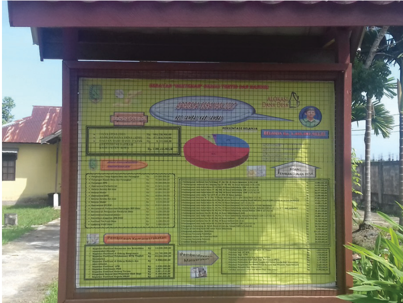
Gambar 7.2 Papan informasi APBDes Desa Sebayan

dipasang di kantor desa dan masing-masing 2 dipasang di tiap dusun. Namun, banner tersebut sangat kecil sehingga tulisan sulit terlihat.